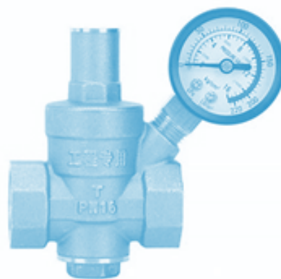
Réducteur de pression